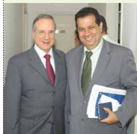
Nelson P. Reis e Carlos Lupi

O objetivo da reunião foi aproximar o segmento químico com o Ministério do Trabalho e Emprego. Durante o debate, Carlos Lupi se colocou à disposição das entidades para contribuir com o desenvolvimento das relações de trabalho e emprego.