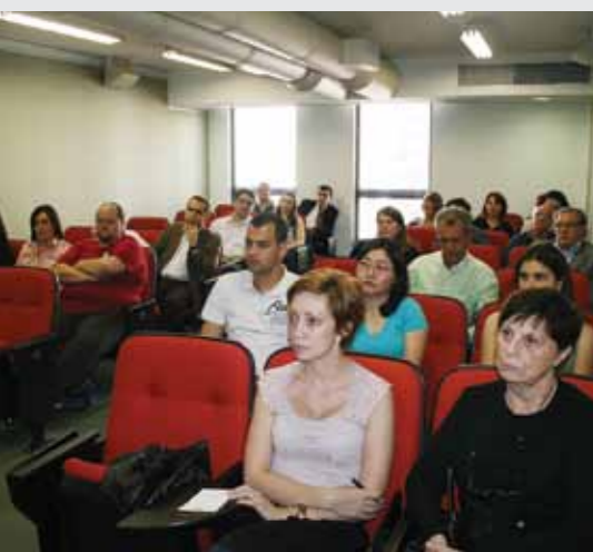
Reunião do dia 20/outubro

Na tarde do dia 27 de setembro, aconteceu, na sede do SINPROQUIM, reunião da comissão que está tratando de desenvolver o programa PreparAR, uma iniciativa conjunta do SINPROQUIM e da Associação Brasileira da Indústria Química – ABIQUIM. Discutiu-se uma longa pauta: processo de capacitação, detalhamento do seminário de sensibilização, qualificação de consultores, o estágio do projeto com o Sebrae, site do PreparAR (conteúdo com planilha para as empresas irem acompanhando, o que tornará mais fácil o entendimento e cumprimento dos itens que já foram feitos e os seguintes), propostas do logo do PreparAR e formação dos núcleos.