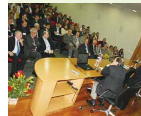
Grande participação de executivos do setor

O Brasil sentiu a crise mundial, mas não quebrou. Quando perguntado o que falta para o Brasil obter bons desempenhos, Sardenberg disse que a dívida pública (PIB) está em 40%, quando o padrão dos outros países é 30% e a dívida bruta está em 60,5% quando o padrão é 38%. “O Brasil cresce menos e investe menos porque gasta muito com o setor público. Isso está sendo um empecilho de crescimento. O governo precisa gastar menos e a dívida pública precisa diminuir”, aponta o jornalista com conhecimento de causa.